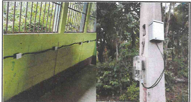
Foto 4: En todas las áreas del centro educativo se hicieron cambios al sistema eléctrico.