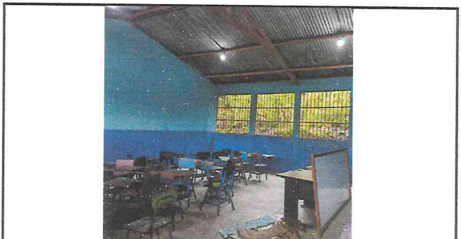
Foto 12: La mayoría de elementos del sistema eléctrico fueron renovados.

Observación: Si es necesario se pueden agregar hojas adicionales y actualizar el número de hojas.