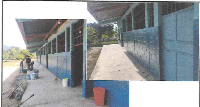
Foto 8: Todas las paredes del centro educativo han quedado renovadas con pintura de aceite azul y agua jade.