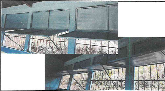
Foto 1: Se ha sellado totalmente el salón que funcionará como área de Computación y bodega.