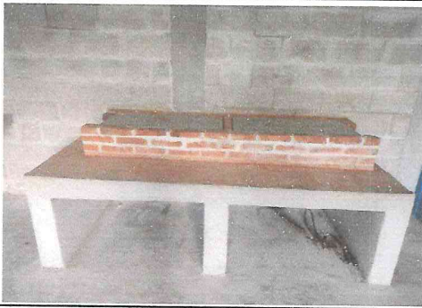
Foto 7: La estufa rural ha quedado totalmente renovada y como se comparte con la escuela primaria, se ha decidido colocar una estufa doble.