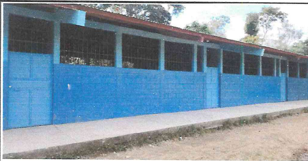
Foto 3: Las puertas principales fueron renovadas totalmente hechas, enchapadas, pintadas e instaladas.