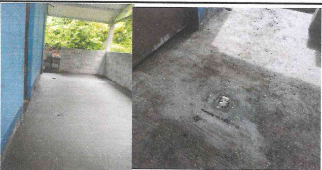
Foto 5: Se han mejorado los drenajes e instalaciones pluviales para que se distribuya correctamente el agua de lluvia y potable.