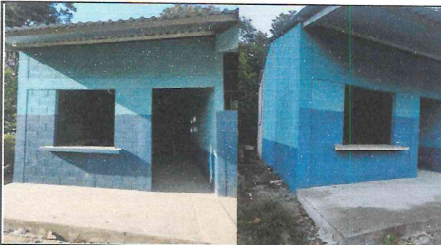
Foto 9: Se han reconstruido paredes, techo y piso de la cocina, aplicado acabados de cemento y pintado.