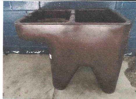
Foto 2: Se ha instalado una pila que servirá como lavadero y lavabo.