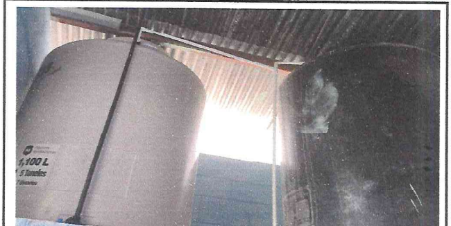
Foto 6: Se instaló un nuevo rotoplas para suplir la necesidad creciente de agua en el Centro Educativo.

Observación: Si es necesario se pueden agregar hojas adicionales y actualizar el número de hojas.